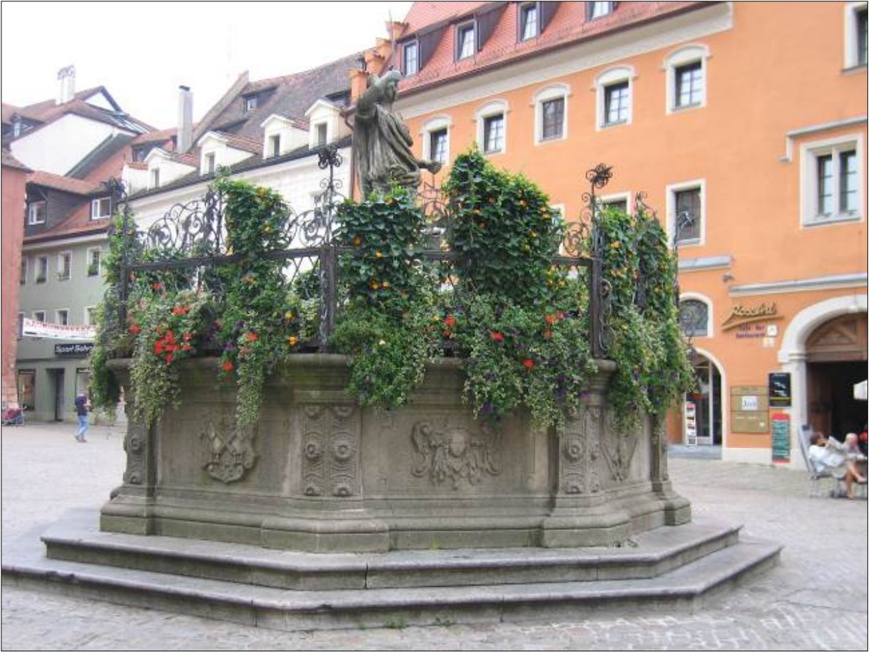
In Piazza Duomo 5 facciamo le prenotazioni per la visita del chiostro del Duomo.