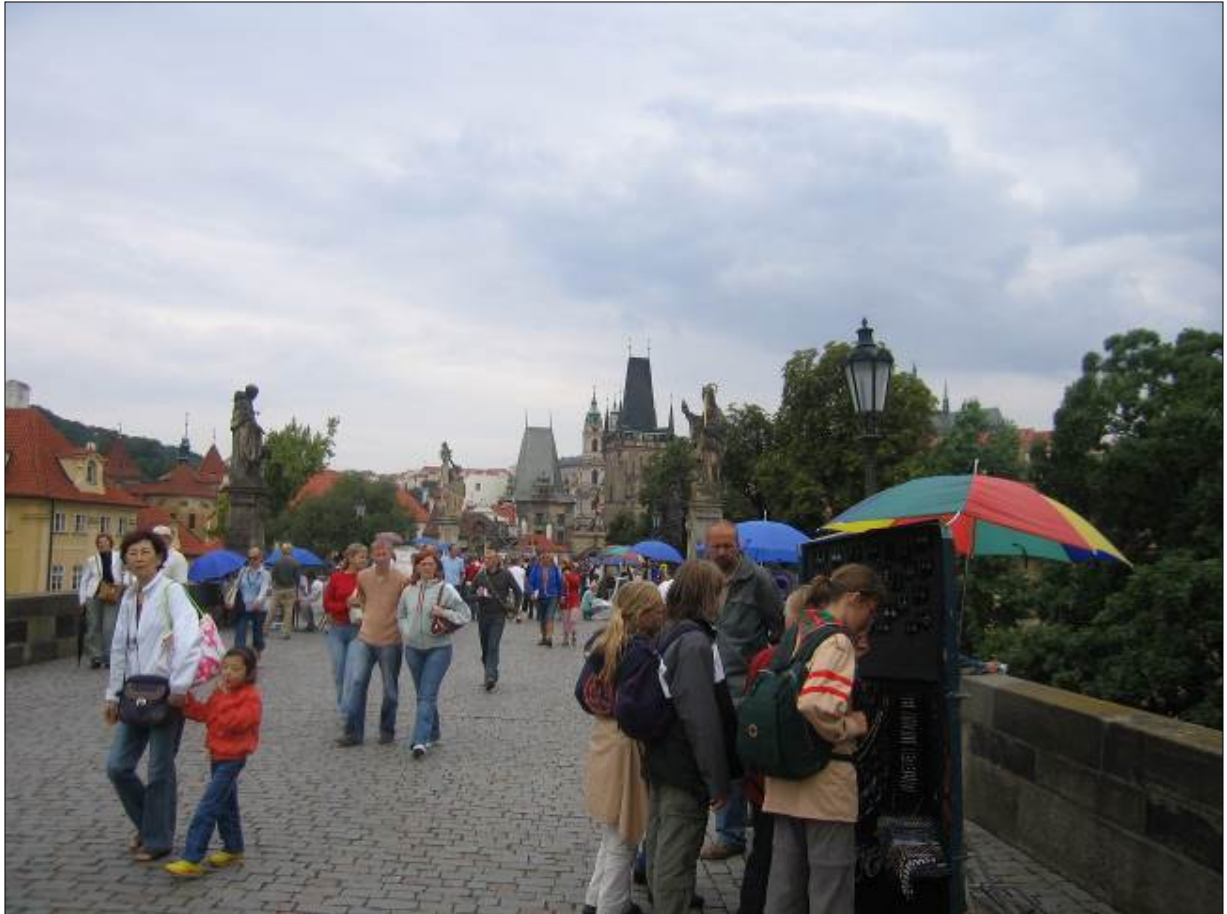
Dall'altra parte del ponte la situazione è un po' meglio, la salita verso il castello è più