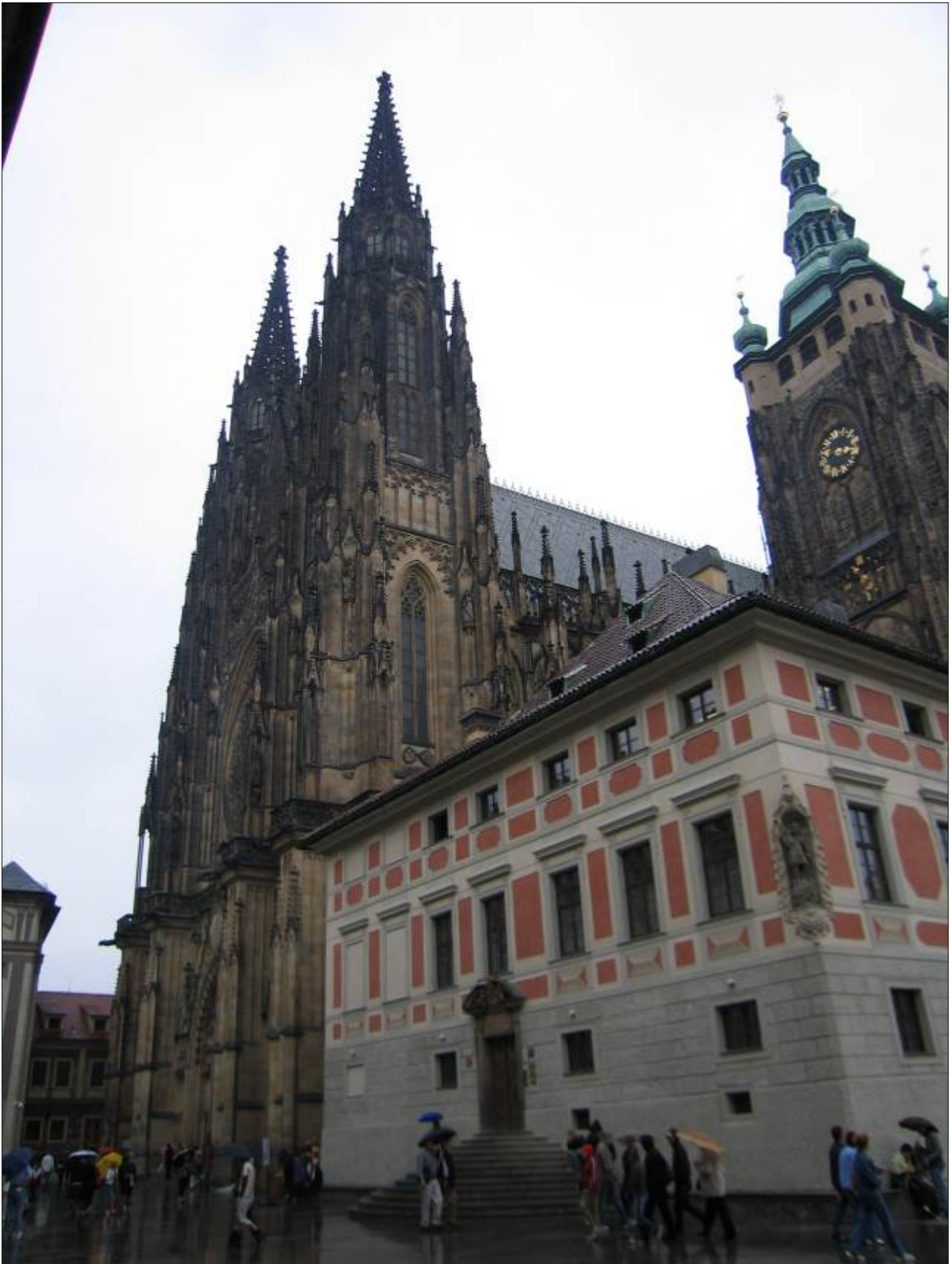
la cattedrale di San Vito.